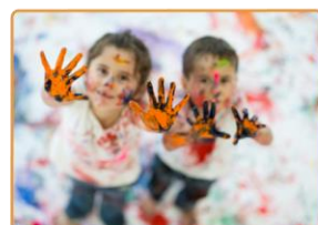
Kennismaken met verf Dorpsboerderij de Kiboe