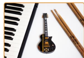
Muziek Abs gitaarles