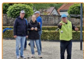
Jeu de boules JBV Le Pionnier