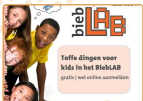
BiebLAB BIJ de bieb