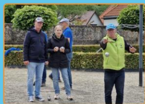
Jeu de boules