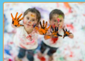
Kennismaken met verf